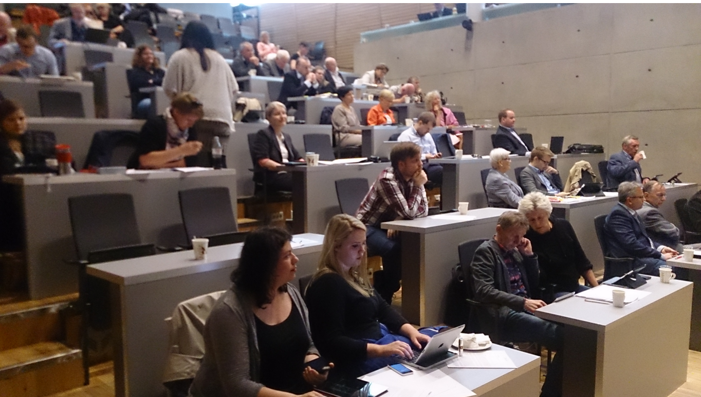
Berre litt makt i denne salen?

Vi har rett og slett vanskar med å sjå kva vi skal med den parlamentariske styringsmodellen i Tromsø.